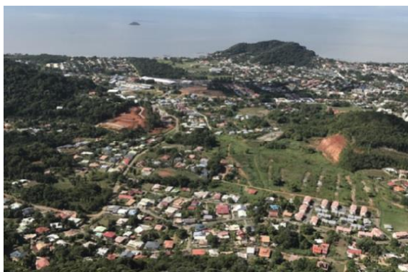
A droite au 2 ème plan, le Mont Lucas.

Avant la végétalisation du Mont, des interventions spectaculaires telles que le nivellement, le remodelage, la sécurisation, le terrassement du Mont Lucas à l'aide de bumpers de 50 tonnes sont en cours. 80.000 m 3 de terre ont été excavés du Mont Lucas pour le sécuriser et ont été revalorisés dans le chantier pour du remblais. 30% de matériaux locaux seront utilisés dans la construction de l'écoquartier.