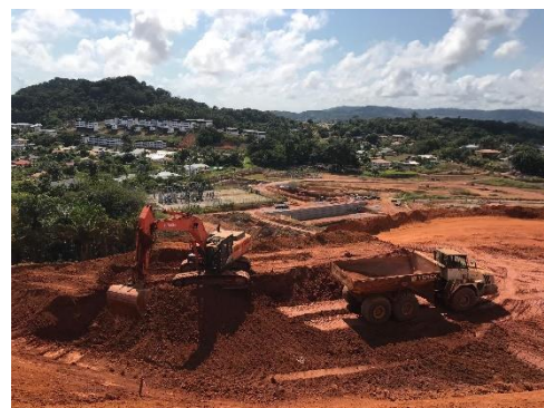
Réemploi de la terre latéritique