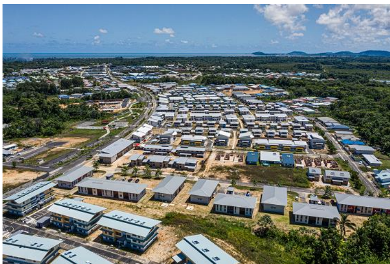
Zac de Soula – Rives de Soula.

Relié les uns aux autres et au centre de Macouria, ces quartiers s'articulent autour d'un paysage contrasté : forêt tropicale, vallons, fleuve, marais.