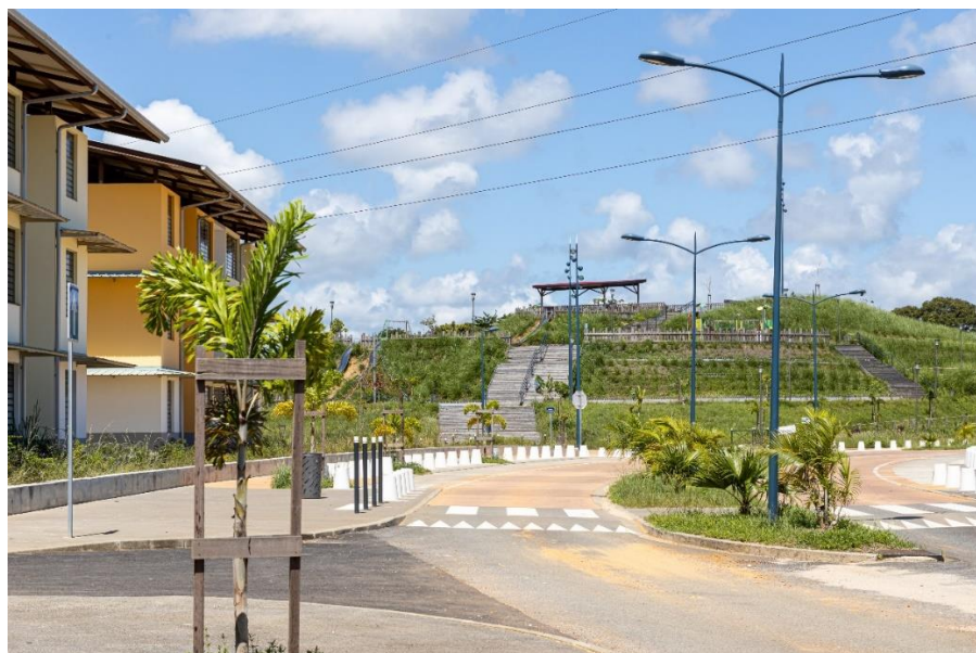
Le Mont Soula – Zac de Soula – Rives de Soula.