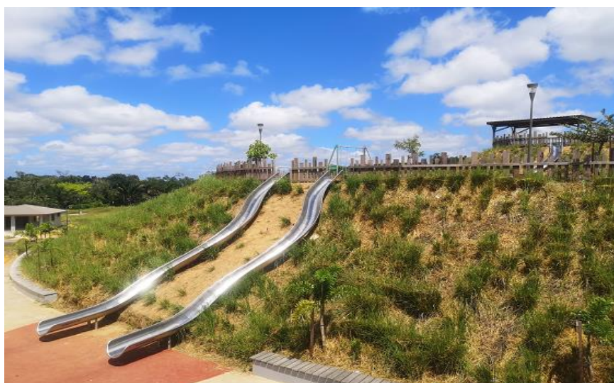
Toboggans du Mont Soula – Zac de Soula – Rives de Soula.