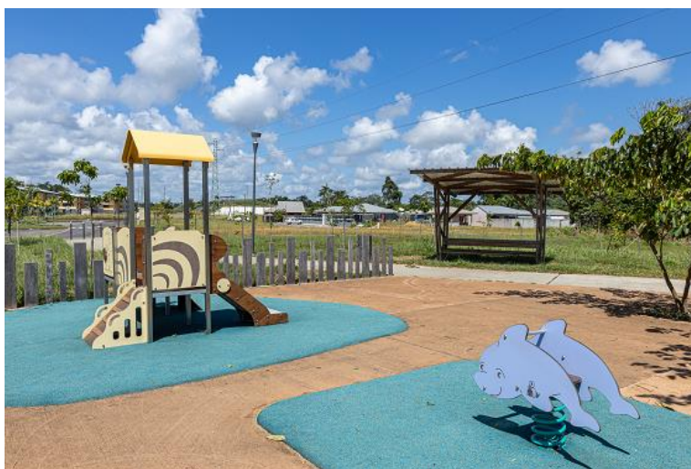
Mobiliers du Mont Soula – Zac de Soula – Rives de Soula.

Les escaliers et mobilier (bancs abrités, passerelles et carbet) sont en bois de Guyane. Les espaces publics sont en béton coloré teinté dans la masse (couleur ocre, anthracite et gris).